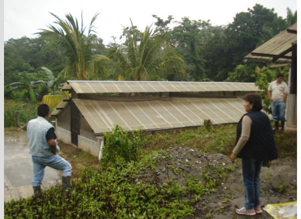
Personal Técnico de FUNDALACHUA y de organizaciones comunitarias, mostrando el centro de transformación primaria (secadoras y fermentadoras) al Equipo de PROPE-

La participación de la Fundación ProPetén y de organizaciones comunitarias socias promueve el compromiso de mantener la cohesión social, ya que esto les permite comercializar el grano de cacao de calidad. Para el equipo de ProPetén es de mucha satisfacción iniciar las gestiones en la comercialización del grano de cacao, y emprender a la generación de ingresos económicos a las familias de las comunidades de enfoque y contribuir a la construcción de un desarrollo sostenible y a la Agrocadena del cacao en Petén.