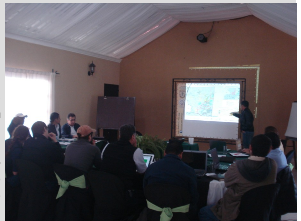
Reunión para la conformación de la mesa Multiactores de cadena del valor del cacao de la región norte de Guatemala.

Atentamente, Comunicación FUNDACIÓN PROPETEN